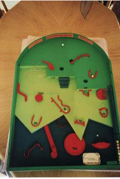
Flipper CHF 10.-