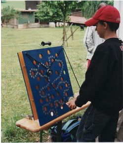
Eigerwand (mit den Fäden wird eine Kugel in einem Ring über die Platte nach oben bewegt - ist auch zu zweit möglich, dann zieht jede/r nur an einem Faden) CHF 5.-