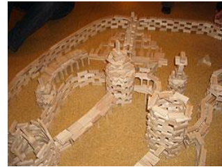
Dominosteine (ca. 4000) CHF 10.-