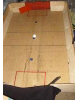
Tischfussball (für 2 Spieler/-innen; wer zuerst fünf Tore geschossen hat, gewinnt; zwei Schwierigkeitsstufen) CHF 5.-