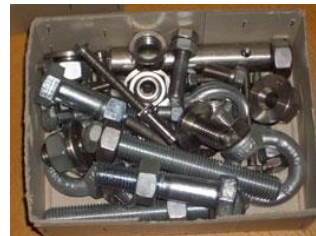
Schrauben zusammen drehen CHF 5.-

Beatrice Gasser, Oberwiesstr.8, 8213 Neunkirch